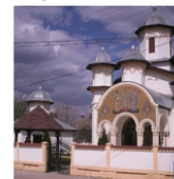
BISERICA "SFINTII TREI IERARHI" PAROHIA ORAȘULUI VIDELE