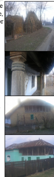
Stiluri arhitecturale influențate de tradiție

Aici regăsim o formă tradițională de planificare a teritoriului , locuințe din paiantă ( ecologice de altfel, conform recentului trend nemțesc inspirat din cultura românească ), stilul scândurilor intersectate specifice zonei Teleormanului , prispa îngustă și lungă cu piloni și uși sculptate ori motive populare , grinzi sculptate , ferestre micuțe , cromatică alcătuită din combinații de două culori (preferate fiind perechile din gamele albastru , verde, crem și alb), mobilier tradițional , port popular, precum și activități agropastorale.